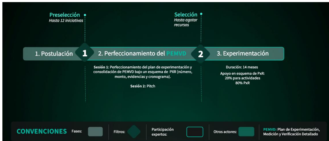
Ilustración 1. Fases del mecanismo de participación

Este llamado cuenta con un mecanismo de participación conformado por tres fases: Fase 1. Postulación, Fase 2. Perfeccionamiento y Fase 3. Experimentación.